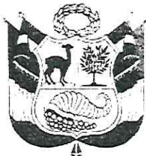
DA - 214158 Javier Santos GALLARDO MENDOZA GENERAL DE POLICÍA COMANDANTE GENERAL PNP