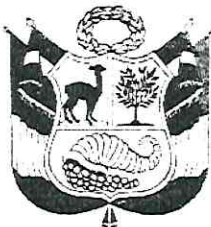
DA - 214156 Javier Santos GALLARDO MENDOZA GENERAL DE POLICÍA COMANDANTE GENERAL PNP