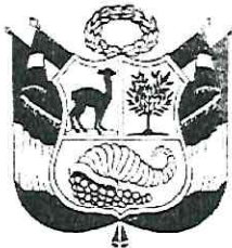
JOA - 214158 Javier Santos GALLARDO MENDOZA GENERAL DE POLICÍA COMANDANTE GENERAL PNP