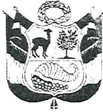
OA - 274058 Javier Santos GALLARDO MENDOZA GENERAL DE POLICÍA COMANDANTE GENERAL PNP