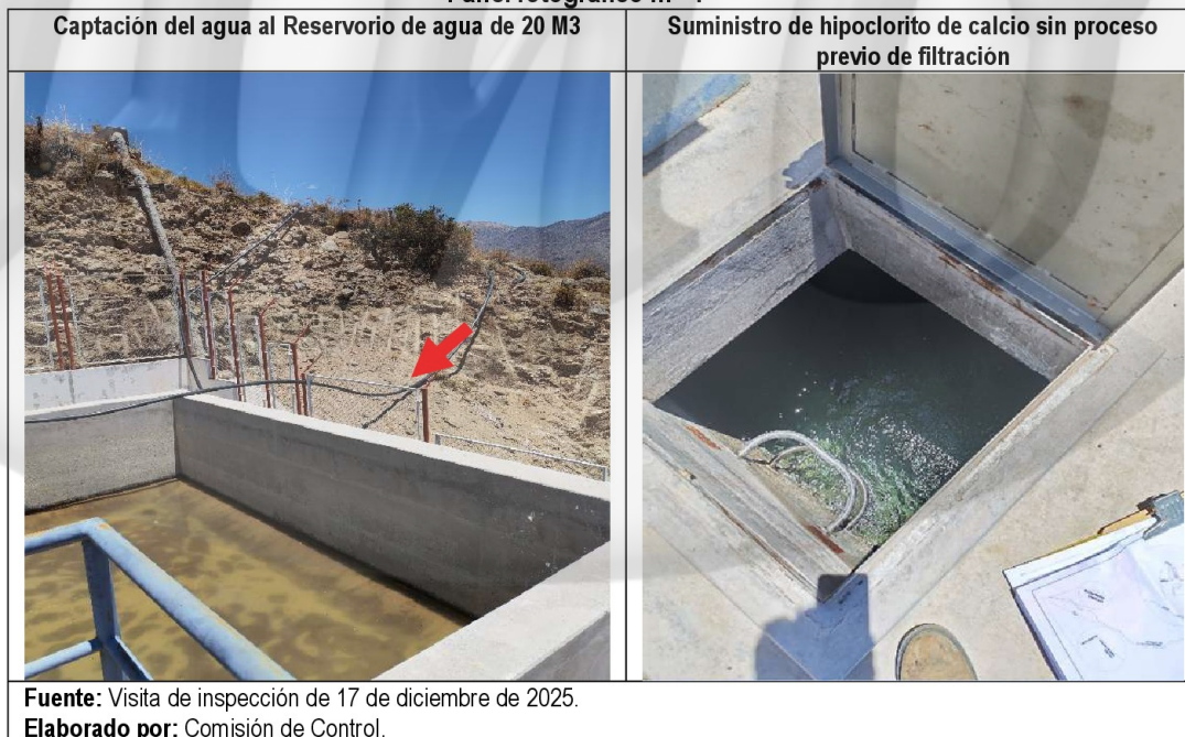
Panel fotográfico n.º 4

Con relación a los hechos descritos, la normativa establece lo siguiente: