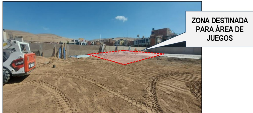
Imagen n.º 9 Zona de juegos

Fuente: Registro fotográfico de visita de inspección realizada el 30 de marzo de 2026. Elaborado por: Comisión de Control.