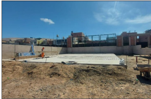
Vista de losa aligerada en Cancha de Baloncesto

Fuente: Registro fotográfico de visita de inspección realizada el 30 de marzo de 2026. Elaborado por: Comisión de Control.