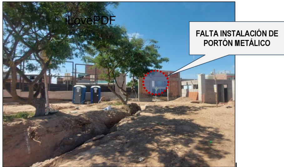
Imagen n.º 12 Cerco perimétrico en campo deportivo (Lado Sur)

Fuente: Registro fotográfico de visita de inspección realizada el 30 de marzo de 2026. Elaborado por: Comisión de Control.