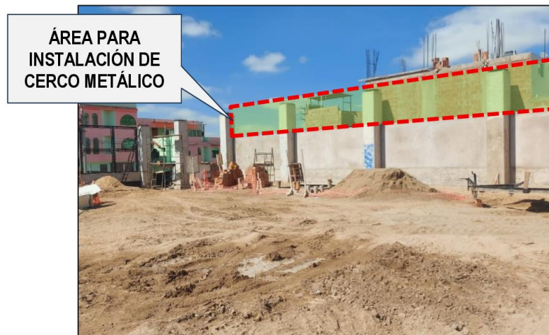
Imagen n.º 10 Cerco perimétrico en campo deportivo (Lado Oeste)