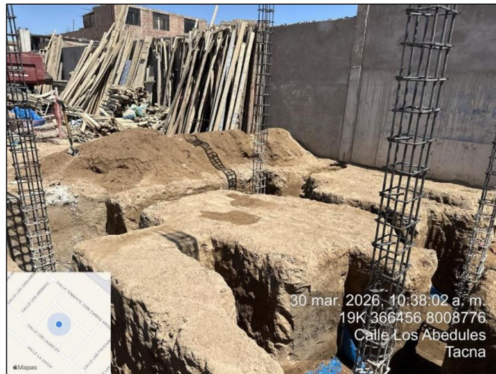
Fuente: Registro fotográfico de visita de inspección realizada el 30 de marzo de 2026. Elaborado por: Comisión de Control.