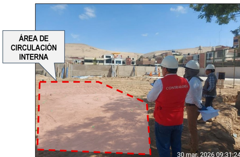
Fuente: Registro fotográfico de visita de inspección realizada el 30 de marzo de 2026. Elaborado por: Comisión de Control.