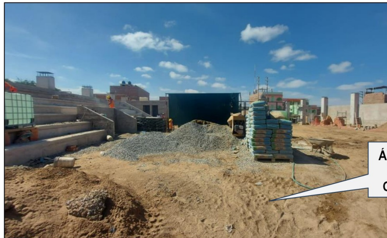
Imagen n.º 2 Vista general de Campo Deportivo