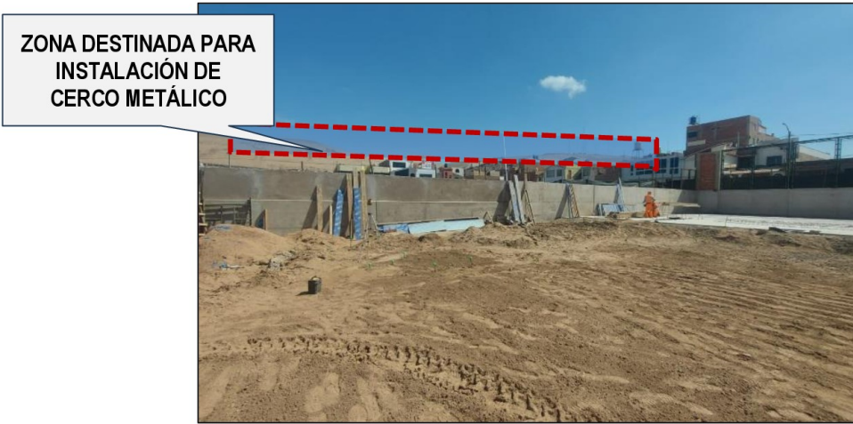
Imagen n.º 11 Cerco perimétrico en campo deportivo (Lado Norte)

Fuente: Registro fotográfico de visita de inspección realizada el 30 de marzo de 2026. Elaborado por: Comisión de Control.