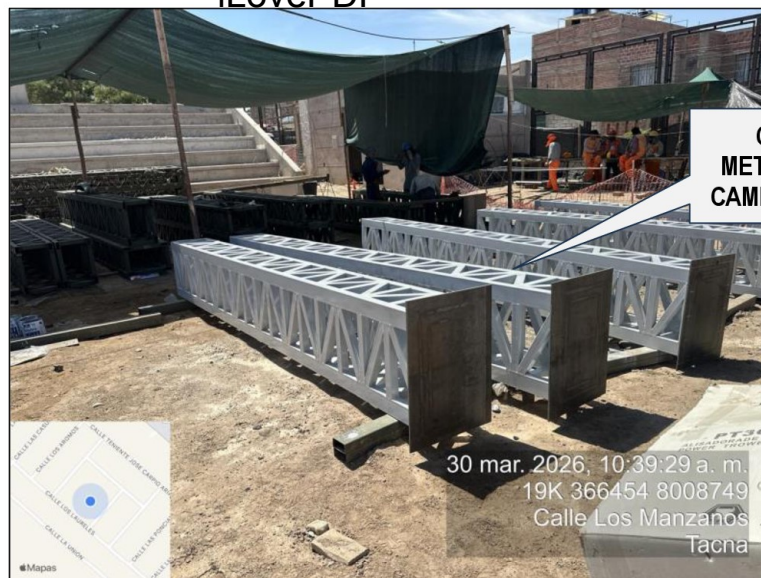
Imagen n.º 3 Columnas metálicas a instalar en Campo Deportivo